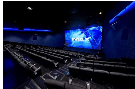
※シアター内イメージ