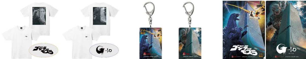
TM & © TOHO

※価格・販売開始日等、商品の詳細は後日、TOHOシネマズ HP にて発表します。