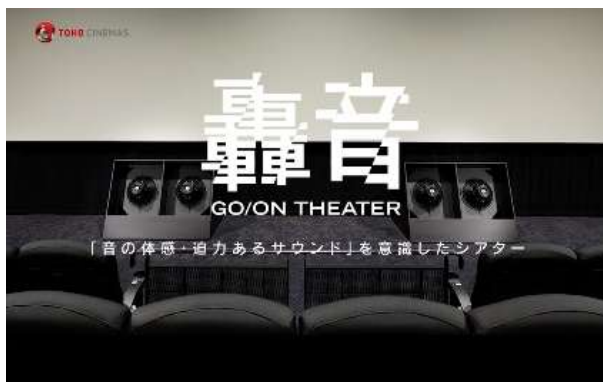
※シアター内イメージ

同じく東海エリアで初めて「音の体感・迫力あるサウンド」に特化した「轟音シアター」を導入します(スクリーン 4)。轟音シアターサウンドシステムは、高精細な再生が可能な“大型 3Way メインシステム”、スピーカーユニットを向かい合わせて駆動させることで通常の 1.5 倍～2 倍のパワーを発揮する“アイソバリックサブウーハーシステム”、そしてメインシステムに劣ることなく広帯域で高精細な再生が可能な“3Way サラウンドシステム”から構成されます。