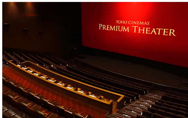
※シアター内イメージ

スクリーン 8 には当社独自規格でワンランク上の鑑賞環境をお届けする「プレミアムシアター」を東海エリアに初めて導入。映画館にとって「映像」「音響」「座席」は重要な要素であり、これらの本質を追求し、こだわり抜いたのが、TOHOシネマズのハイエンドシアターである「プレミアムシアター」です。TOHOシネマズ独自規格により高いコストパフォーマンスを実現します。