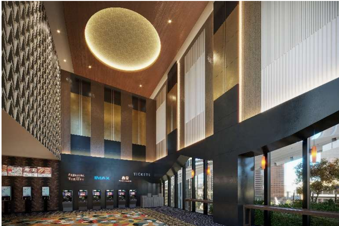
※ロビー内イメージ

2026年6月11日(木)に開業する「TOHOシネマズ 名古屋栄」は、エリア初の設備を多く導入し、多様な映画の楽しみ方を提供する映画館です。